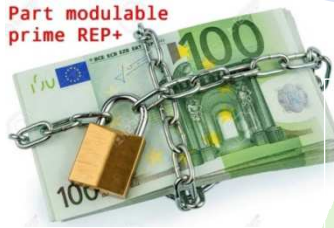
Part modulable prime REP+

La part fixe est versée chaque mois, la part modulable à l'issue de l'année scolaire. Son versement était annoncé par le rectorat sur la paye de septembre 2022, mais RIEN !!!