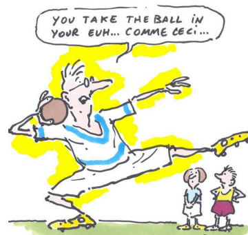
Le SNUipp-FSU avec vous

Dans le préambule des programmes de 2008, la liberté pédagogique est réaffirmée mais le contenu et les orientations de ceux-ci impactent la conception de la pédagogie.